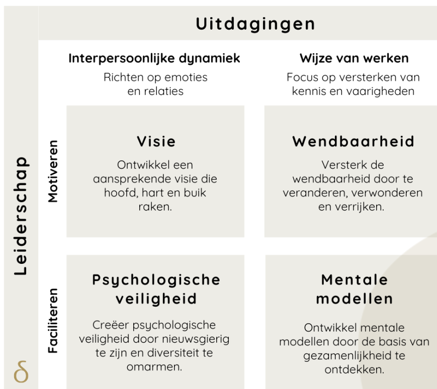
Fig.2. Organise to Learn matrix (Amy Edmondson)